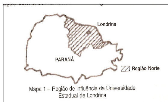
Figura 1: Localidade UEL/PR